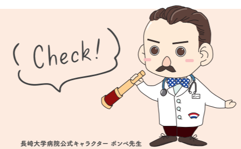
長崎大学病院公式キャラクター ボンベ先生