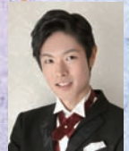
村松 稔之 countertenor