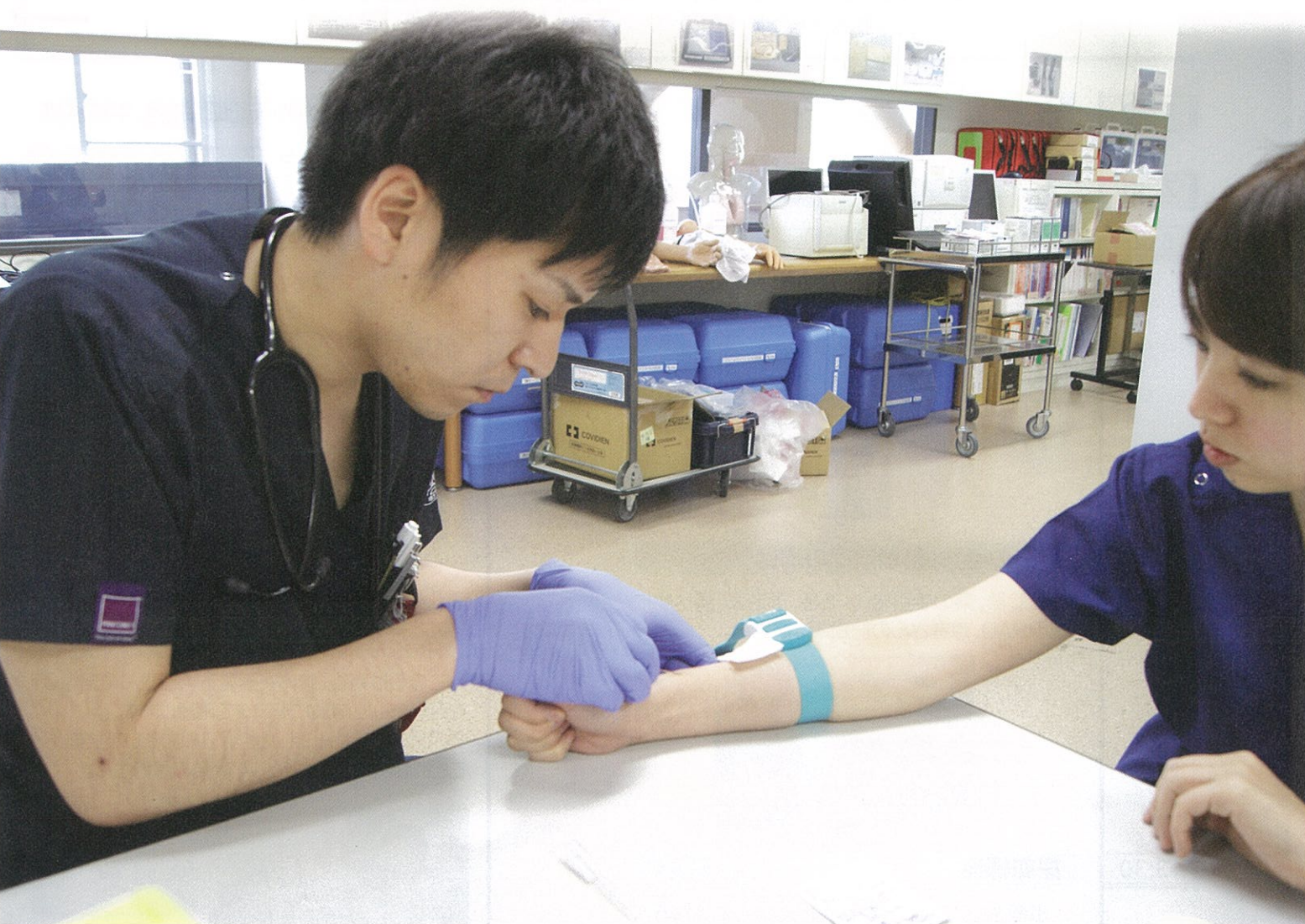
研修医同士で採血の練習をする様子