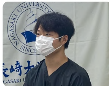
岩手医科大学出身・M先生 (研修医1年目)