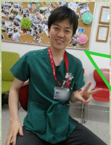
長崎大学出身 研修医1年次O先生

僕は4年生のポリクリくらいから勉強を始めました。まずはQBで正答率が高い簡単な問題から解いて、少しずつ難しい問題をやっていきました。コツは典型的な臨床問題の症例が出題されたらとにかく病歴(ストーリー)ごとで覚えることです。そして同じような病歴が出たらコレだ！という感じです。国試の勉強は深く掘り下げすぎず、QBなどを繰り返し解いて広く浅く勉強を行うと良いでしょう。