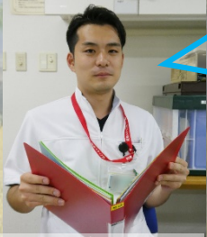
長崎大学出身 研修医1年次S先生

他の研修医の先生方の意見で最も多かったのが「勉強部屋の利用」について。1人で勉強するよりも仲間と一緒に勉強するほうが効率が上がった！という声が多い。