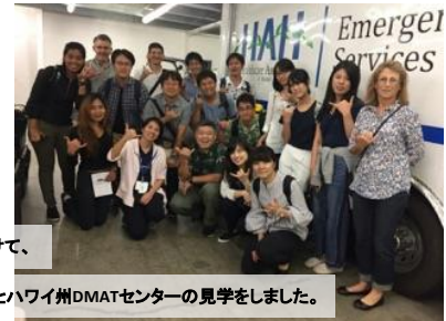
最終日の5日目は、午前と午後に分けて、