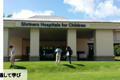
2日目の午前中は医療英語の講義と 医療安全について、日米の違いをシミュレーションを通して学び