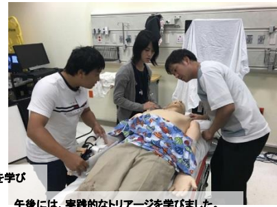
3日目の午前は、困難な気道確保の症例を学び