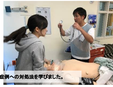
初日は、オリエンテーションから始まり 午後は夜勤当直時に起こりやすい症例への対処法を学びました。